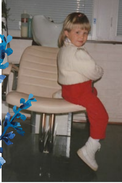
Hanna-Riikka on seurannut alaa läheltä lapsuudesta saakka.

Hirveän harvoin sanon millekään suunnitelmalle ei.