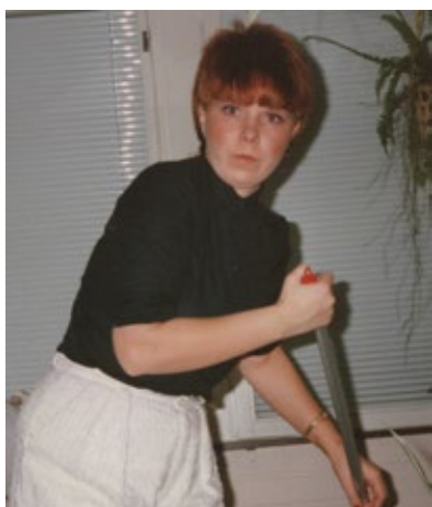
Monitoiminainen omassa uudessa liikkeessään tuoreena yrittäjänä 80-luvulla.