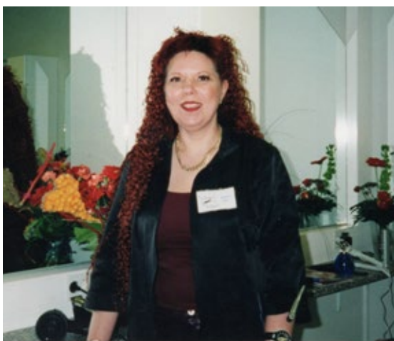
Maaritin yritys laajentui Nummelaan vuonna 2001, kuva avajaispäivältä.