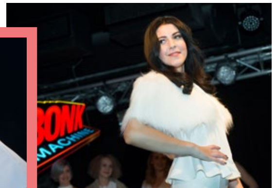
Salon Klipsi järjesti upean hiusnäytöksen yhteistyössä Wellan kanssa, malleina hyödynnettiin myös omaa asiakaskuntaa.